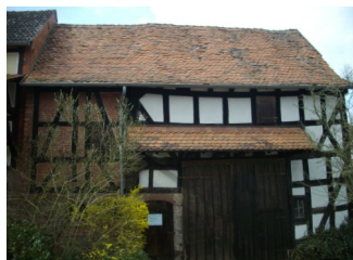
Kleinbauernscheune mit Kuhstall

Der Arbeitskreis wurde 1980 durch Schwabendorferinnen und Schwabendorfer gegründet, die an der Geschichte ihres Hugenotten- und Waldenserortes interessiert waren. Schon seit 1970 unternahmen Gruppen aus dem Ort Fahrten nach Italien und Frankreich, um die Gebiete kennenzulernen, aus denen die Vorfahren Ende des 17. Jahrhunderts aufgebrochen waren. Sie mussten sich eine neue Heimat zu suchen, nachdem ihnen die Religions- und Gewissensfreiheit in Frankreich versagt worden war. Die intensive Beschäftigung mit der Geschichte führte dann zur Gründung des "Arbeitskreises für Hugenotten- und Waldensergeschichte Schwabendorf e. V."