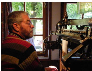
Funktionsfähiger Strumpfwirkstuhl (18. Jh.)