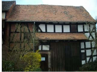
Kleinbauernscheune mit Kuhstall

Der Arbeitskreis wurde 1980 durch Schwabendorferinnen und Schwabendorfer gegründet, die an der Geschichte ihres Hugenotten- und Waldenserortes interessiert waren. Schon seit 1970 unternahm Gruppen aus dem Ort Fahrten nach Italien und Frankreich, um die Gebiete kennenzulernen, aus denen die Vorfahren Ende des 17. Jahrhunderts aufgebrochen waren. Sie mussten sich eine neue Heimat zu suchen, nachdem ihnen die Religions- und Gewissensfreiheit in Frankreich versagt worden war. Die intensive Beschäftigung mit der Geschichte führte dann zur Gründung des "Arbeitskreises für Hugenotten- und Waldensergeschichte Schwabendorf e. V."