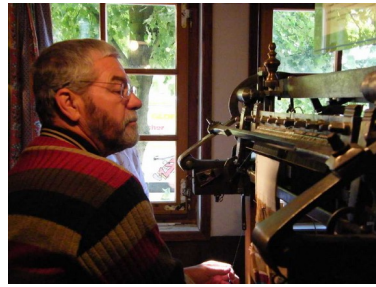
Funktionsfähiger Strumpfwirkstuhl (18. Jh.)