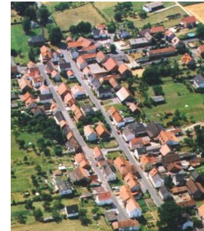
historische Ortsanlage von Schwabendorf